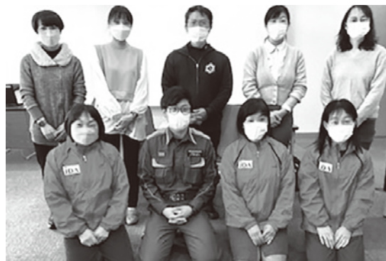
救命救急士とJDA-DATリーダー