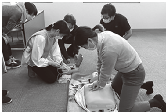
令和4年11月5日(土) 救命救急士による救命救急講習